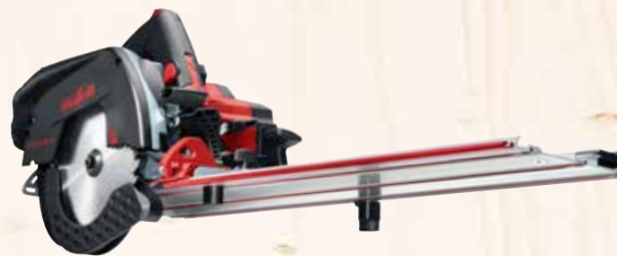
Kappschiene-Säge KSS 60 18M bl